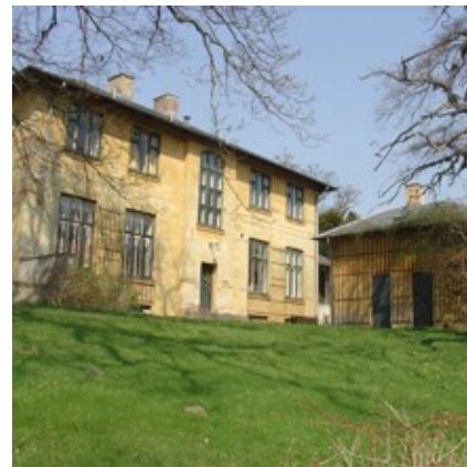
"Den gamle skole" i Brede er opført i 1893 og fredet i 1991. Ejendommen anvendes idag til beboelse.

Alle større rækkehusbebyggelser er særskilt registreret. Registreringerne omfatter en beskrivelse af de enkelte rækkehusområders dominerende træk; deres strukturer og sammenhænge, deres arkitektur, deres grønne præg og helhedsindtryk samt deres bevaringsværdi. Registreringerne kan downloades her .