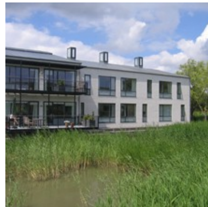
I 2007 opførte Lyngby-Taarbæk Kommune 36 nye boliger på Områdecener Virumgård.

Som grundejer kan kommunalbestyrelsen ved salg af bevaringsværdige kommunale ejendomme stille skærpede krav om fremtidig vedligeholdelse og bygningers fremtoning. Det gælder blandt andet opretholdelse af evt. bevaringsværdi og -tilstand for at undgå upåagtet forfald.