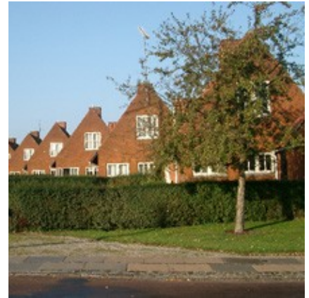
Rækkehusene på Nonnebakken er tildelt bevaringsværdi 3. Bebyggelsen er opført af Lyngby Almennyttige Boligselskab i perioden 1943–1946.

Kommunalbestyrelsen har desuden besluttet, at områder med særlig kulturhistorisk værdi f.eks. landsbyer kan udpeges i lokalplaner. Dette betyder ikke, at al bebyggelse i en landsby er bevaringsværdigt.