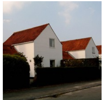
Rækkehusbebyggelsen Egeparken, tegnet af arkitekt Kay Fisker, opført i perioden 1949–1956.