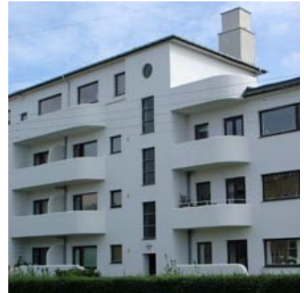
Etageejendommen "Sportshuset" er beliggende i Ulrikkenborg og opført i 1932–1934 i international funktionalistisk stil.

Begreber som balance, rytme, proportioner, komposition, stoflighed, lys og skygge indgår som det kunstneriske indhold og er en stor del af arkitekturen og kan give betragteren en oplevelse og en fornemmelse af kvalitet.